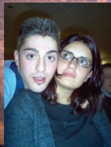
Il tesoriere e il "tesoro" della Pro Loco