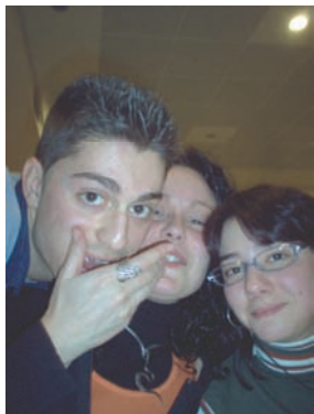
Vecchi membri e Nuove leve