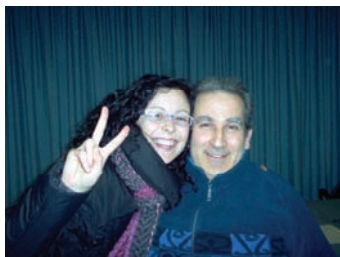
Il Boss e la Pupa

pre di più i cittadini alla partecipazione, alla socialità e al divertimento. Questa è una delle tante iniziative previste per la celebrazione di questo anniversario, celebrazione che non festeggia soltanto un'associazione ma anche e soprattutto coloro che per tutti questi anni ne hanno fatto parte.